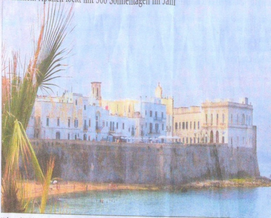
Hafenstadt mit langer Geschichte: Gallipoli liegt direkt am Mittelmeer und ist nur einer von vielen Orten, an denen man auch baden kann.

Süditalien: Apulien lockt mit 300 Sonnentagen im Jahr